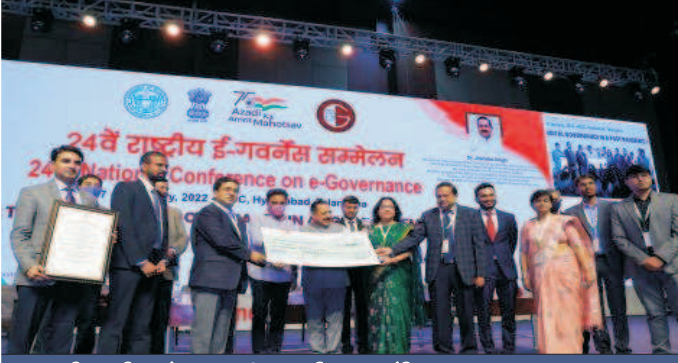
ईमार्ग को राष्ट्रीय ई-गवर्नेंस रजत पुरस्कार