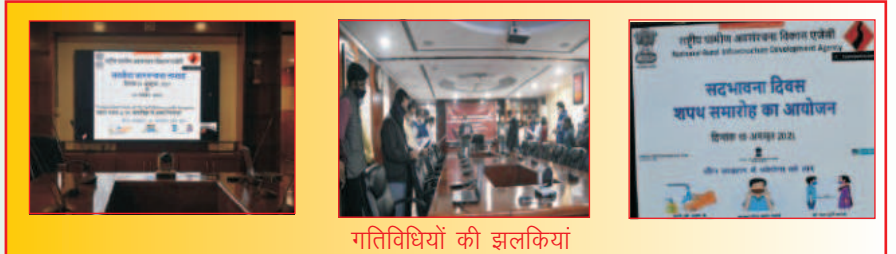
गतिविधियों की झलकियां