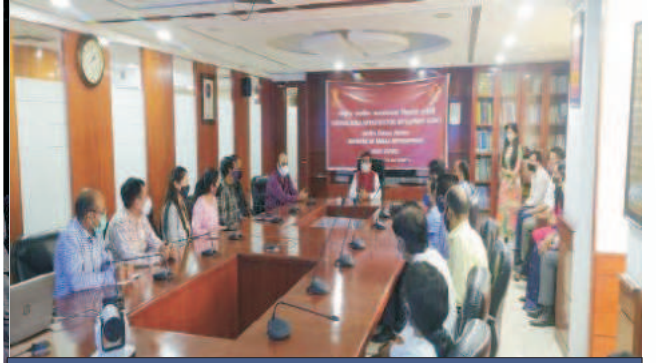
राजभाषा हिन्दी स्मारिका का विमोचन