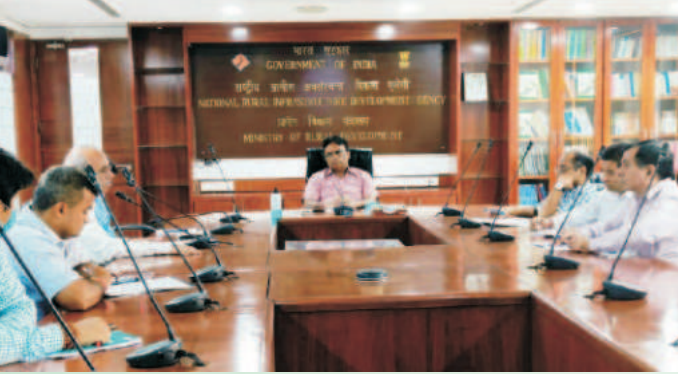
राजभाषा कार्यान्वयन समिति की तिमाही बैठक