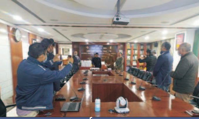
नव वर्ष 2022